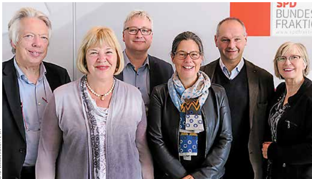
Die Landesgruppe im Bundestag hat sich neu formiert: Ernst Dieter Rossmann, Bettina Hagedorn, Sönke Rix, Nina Scheer, Mathias Stein, Gabriele Hiller-Ohm.

Ernst Dieter Rossmann hat der Landesgruppe über 15 Jahre Gesicht und Stimme gegeben. Dafür dankte ihm die Landesgruppe auf ihrer Wahl-Sitzung. Stellvertreterin bleibt die Lübecker Abgeordnete Gabi Hiller-Ohm. Ernst Dieter Rossmann kündigte an, nicht nur in seinen