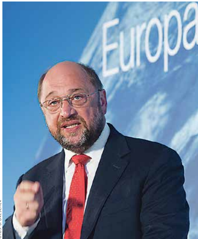
Martin Schulz: Vorrang hat der Kampf gegen Jugendarbeitslosigkeit.